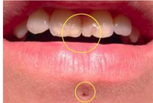
Tandbreuk [Foto: Levin L, Zadik Y. Am J Dent. 2007 Oct;20(5):340-4]

Lippiercings in de onderlip kunnen verantwoordelijk zijn voor de terugtrekking van het tandvlees. Maar ook tongpiercings kunnen dat effect hebben. Lippiercings veroorzaken vooral terugtrekkend tandvlees aan de voorkant van de tanden. Tongpiercings juist aan de achterkant. De wortels van de onderste snijtanden kunnen (gedeeltelijk) bloot komen te liggen. De wortels van je tanden zijn niet voorzien van een sterke laag glazuur. Ze bestaan uit tandbeen. In dit poreuze materiaal zitten kanaaltjes die verbonden zijn met de zenuwholte binnenin de tand. Als je tandvlees de kanaaltjes afsluit, merk je daar niets van. Is het tandvlees weg, dan komt door warme, koude, zoute of zure prikkels het vocht in die kanaaltjes in beweging. Die beweging irriteert de zenuwen en veroorzaakt zo de pijn. Eenmaal teruggetrokken tandvlees komt niet meer terug.