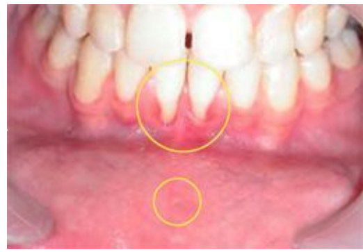
Terugtrekkend tandvlees

Met een mondpiercing heb je meer kans op het krijgen van ontstoken tandvlees. Rood, gezwollen of bloedend tandvlees duidt er meestal op. Voornamelijk bacteriën zijn de veroorzaker van ontstoken tandvlees. Vaak is een ontsteking van het tandvlees oppervlakkig. In ergere gevallen kan de ontsteking verder gaan en het daaronder gelegen kaakbot aantasten en afbreken. Hierdoor kunnen je tanden en kiezen zelfs los komen te staan en uitvallen. Met een goede mondhygiëne kun je tandvleesontsteking voorkomen.