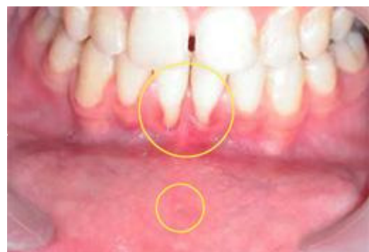
Terugtrekkend tandvlees

Denk er allereerst goed over na of je echt een mondpiercing wilt laten zetten. Besluit je toch voor een mondpiercing te kiezen? Kies dan altijd voor een professionele piercer om onnodige schade aan zenuwen en bloedvaten te voorkomen. Laat je goed adviseren. Zorg altijd voor een goede mondhygiëne en bezoek je tandarts of mondhygiënist tweemaal per jaar voor controle.