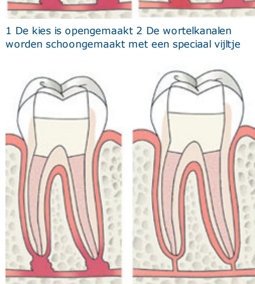
1 De kies is opengemaakt 2 De wortelkanalen worden schoongemaakt met een speciaal vijltje

behandeling. Uw tandarts maakt eerst uw tand of kies open en verwijdert het ontstoken weefsel. Daarna reinigt hij het kanaal met kleine vijltjes en spoelt hij het met een desinfecterende spoelvoeistof. Vervolgens worden de kanalen gevuld. Na de wortelkanaalbehandeling maakt uw tandarts uw tand of kies weer dicht met een vulling. Als de kies is verzwakt, kan een kroon nodig zijn. Een tand of kies die op deze wijze is behandeld, kan nog lange tijd mee.